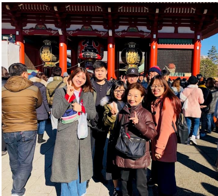
浅草寺本殿前で集合写真！

日本の歴史的な建物にも触れ、優しい日差しの中で穏やかな初詣となりました。ただ、少し寒かった・・・笑